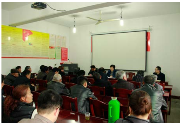
市第十二次党代会精神宣讲会