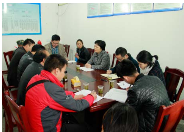
与村干部、村民代表、党员代表举行座谈，了解永嘉桥村发展现状

几天的蹲点走访，调研组的同志们真正用脚步丈量了民情，深切感受到群众的淳朴和勤劳，智慧和力量，对村庄建设和美好生活的期盼。干部走访拉近了与群众的距离，真正地做到从群众中来，到群众中去，让党员干部学到了很多，也思考了很多，更加坚定了全心全意服务群众的工作信念。