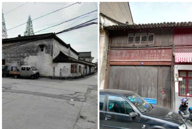
顾家门上隐约可见的标语（左）和望族厉家大院外景（右）

是南街在早市时段，人流拥挤造成交通不畅，同时也影响农户在街上自产自销。为此，当地政府一面花力气整顿市容、加强管理；一面将锦登桥拆除，填平市河，开辟了一处露天菜场先行过渡。后在市东侧新建五杭农贸市场。从此老街上的市面日渐冷清，但原有店房、民宅时至今日仍基本保持旧貌。