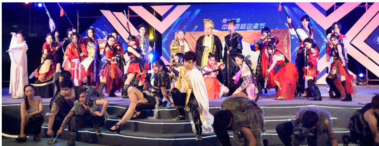
4月30日，第十三届中国国际动漫节“中国COSPLAY超级盛典”团队组总决赛在白马湖动漫广场落下帷幕