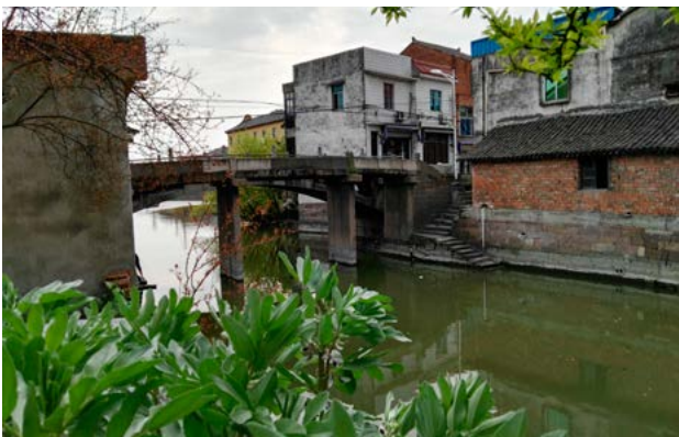
玉露古桥东侧并行新建公路桥，可通小型车辆

旧时，五杭庙宇也多。境内有宝光寺、大禹王庙、澄溪庙、前溪庙、关帝殿、太平庵、塘北庵等十余处。当年，各个寺庙佛香燎绕、供烛不断、佛事连连。这些寺庙经岁月的洗礼、“文化大革命”的毁坏，至今大多已不复存在了。20世纪30年代，乡里规模最大的宝光寺毁于匪患战乱。解放后，该寺的残留房舍改为乡中心小学所在地多年。