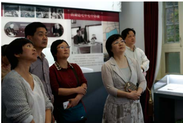
杭州市地方志办公室全体全体党员在参观“五四宪法”历史资料陈列馆 (吴铮摄)

随后，全体党员来到了位于西湖三台山麓的于谦祠。于谦（1398—1457）字延益，是明代著名的清官和民族英雄，与岳飞、张煌言并称“西湖三杰”。