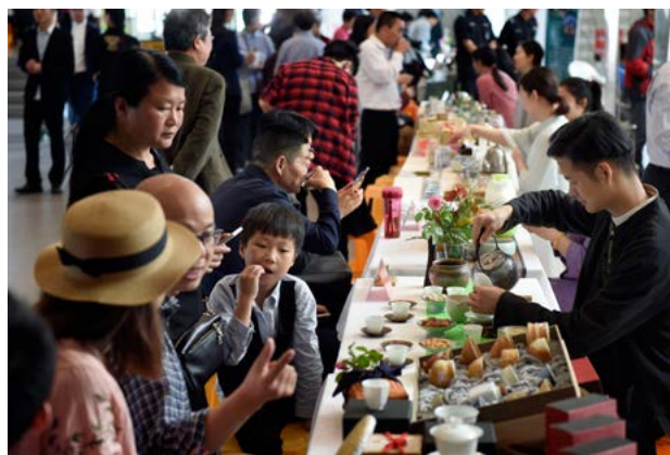
4月22日, 2017全民饮茶日暨第六届万人品茶大会在古运河畔的杭州刀剪剑博物馆举行

自2012年起, 杭州市将每年的农历谷雨日定为“全民饮茶日”, 并逐步得到国内近百个城市及世界五大洲茶友们的积极响应。