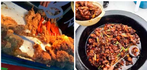
五杭炸鸡及油炸食品（左）和传统柴火土灶红烧羊肉（右）

五杭还有美食街市，常年供应各种美味佳肴，如炸鸡、醋烧鱼块、肉羹等，还有闻名四邻的当家菜——红烧羊肉。它的做法与众不同，是用传统柴火土灶，再加各类辅料煮成的，用于酒家、饭铺、家餐，让人品尝后回味无穷。街上有名的万士达红烧羊肉，日销500碗，一个冬季总销量达3吨之多。