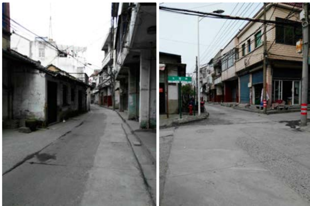
五杭南街（左）和玉露路的街景（右）

五杭成市较早，南宋时已载入史册。宋元时期，五杭商贸街市兴起，明清起渐趋繁荣。现辖区内主要街路有东明路、繁荣路、玉露路等22条。旧时老街，以南街为主、东街次之。古镇的集市中心原有一座小石桥名曰锦登桥（俗名鳊鲛桥），它横跨市河与南街相接，北堍过街路直对胡家弄。这条宽度仅2米多的狭窄街市，长不足200米，原先是石板路，现已浇筑水泥路面。当年街上聚集了各行各业的经营场所，店铺相向毗邻营业，一间挨着一间，十分紧凑，每天早市时人们上街赶集、喝茶、购物，热闹异常。街上的各种建筑都是江南的缩影，有茶馆、肉铺杂货店、剃头店，它们在历史的沧桑中，木屋的红漆大都褪色，显得十分陈旧……20世纪70年代，因镇上农贸市场空间太小，特别