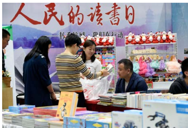
4月21日,“2017西湖读书节”以别具一格的“文创书市”形式在浙江展览馆拉开帷幕

接下来的半年时间里,杭州在校园、乡村、社区,特别针对青年、特殊人群开展讲座、沙龙、送书等形式的400多场阅读推广活动,实现全民阅读全覆盖。