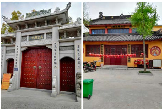
禹皇禅寺大门（左）和禹皇禅寺内的大殿（右）

禹皇禅寺（原名大禹王庙、又称五杭大庙）因四乡百姓为敬祀大禹王，常年香火不断。每逢庙会或重大佛事时，常有剧团演出，让四方的香客赶来闹猛几天……解放后直至20世纪90年代，改为五杭供销社给麻收购站。近年来，开始恢复原貌，修缮了禅寺大门，重建了大雄宝殿、佛堂、戏台等建筑。经过维修、改建后改称现名。目前寺内呈现古朴典雅，法相庄严，香火旺盛景致，是四周八方的香客朝拜和旅游者好去处。