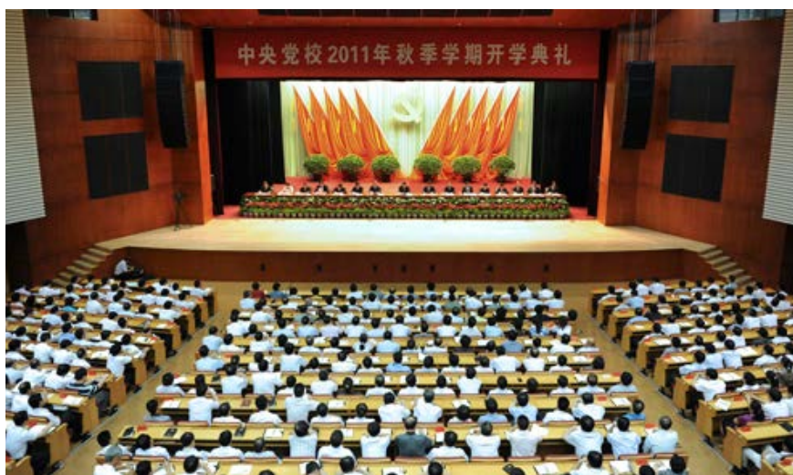
2011年9月1日，中共中央政治局常委、中央书记处书记、中央党校校长习近平出席中央党校2011年秋季学期开学典礼并讲话，强调领导干部不管处在哪个层次和岗位，都应该读点历史，从中汲取智慧和营养，不断提高认识能力和精神境界 （新华社记者 谢环驰 摄）