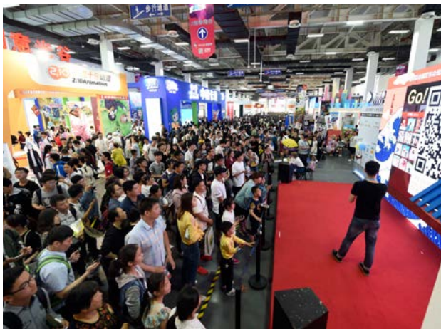
4月30日，大批市民游客乘着假日涌向白马湖动漫节场馆内感受国际动漫盛况

奖。杭产作品有6件获奖。其中，在综合奖方面，杭州天雷动漫有限公司出品的《小鸡彩虹》第一季获得了动画系列片类银奖，中国美术学院制作的动画短片《梅花三弄》获得了动画短片类银奖。潜力奖方面，中国美术学院的作品《月老》获得了潜力动画短片奖，浙江传媒学院的三部漫画作品《橱窗里的兔子先生》、《暑假日记》和《M猪旅行记忆》获得了潜力漫画奖。