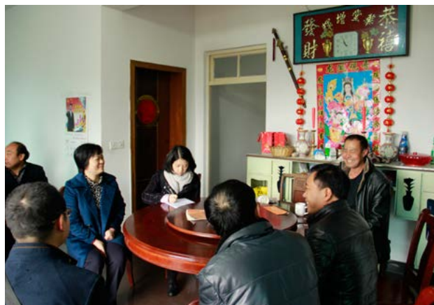
调研组在农户家里了解情况