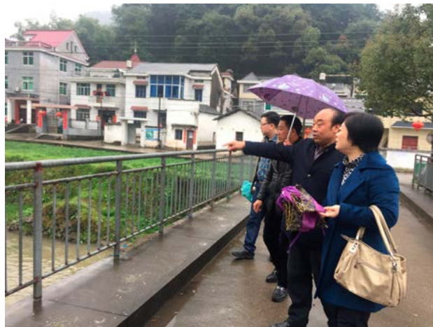
调研组现场查看南浦溪整治情况

河道已经整治过的一边说：“去年村里争取到了20多万元的资金，把河道一边弄好了。上下游还有很多段没有资金搞整治，如果碰到下大雨发洪水，容易冲垮堤岸，旁边的农田也会被淹掉。”调研组认真地查看了现场，记录下大家所反映的问题。