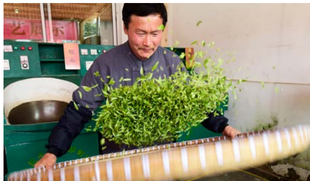
径山茶炒制技艺之“摊青”步骤