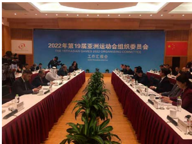
挂牌仪式后，杭州亚组委向亚奥理事会专题汇报了亚运会筹备事宜

4月17日下午，位于体育场路270号的杭州亚组委办公大楼正式挂牌，这也标志着2022年第十九届亚运会各项筹备工作进入了新的阶段。挂牌后，杭州亚组委举行了专题工作汇报会。亚组委由“一