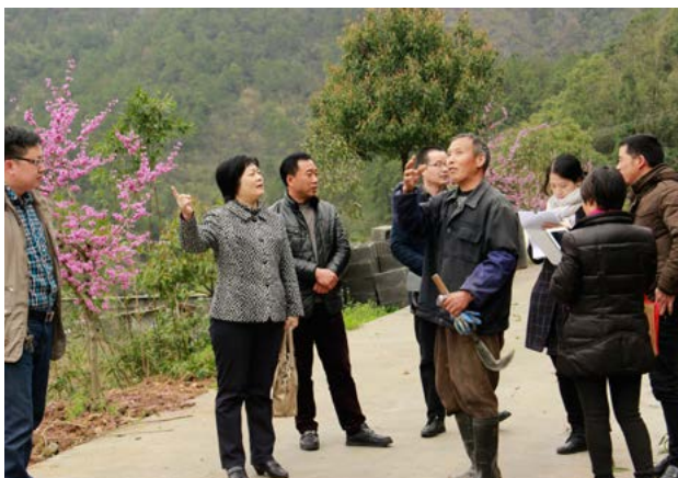
调研组一行来到金苗生态农业考察

在坟山自然村的一个山坳里，调研组走进了金苗生态农业基地，现场查看了生态农业的规划建设。来自萧山的金氏夫妇已经在这里盖了新楼房，发展了不小规模的西红花种植和其他生态农业。