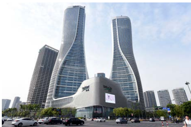
4月27日，杭州来福士中心正式开业

作为全省第一家按照LEED金奖标准设计建造的综合体，杭州来福士高大上的双塔曲线造型和超现代的不对称菠萝表皮设计可圈可点。来福士前期公布的人驻品牌名单中，有喜茶、言几又、WIN HOUSE等“网红店”，还有川味观旗下新品牌蔴将、张生记副牌ECHEE、胖哥俩的高端副牌蟹觅、主打老底子杭州菜的“杭儿风”、臻货旗下的董鲜生、杭州网红餐厅始祖绿茶以及蟹屋、太兴等