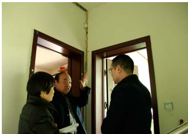
调研组现场查看房屋损坏情况

走着走着，我们进了一户矮墙小院。调研组同志们进屋和家里的二老聊了几句。原来两夫妻身体都不太好，当问起目前家里最大的困难，老太太说道：“家里的房屋一侧因为地基下陷，房子都裂开了。”随行的联村干部解释道：“前不久村里用钢梁给房子做了户外的加固，具体的危房整修在申报中。”老太太听了也宽心地点点头。