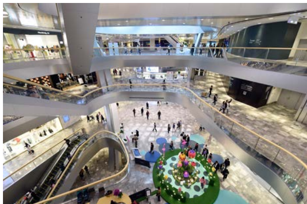
杭州来福士中心内部场景