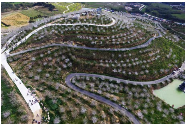
4月3日，余杭区瓶窑镇塘埠村樱花基地里，7万株樱花进入盛花期

化家园”、立体花坛、自然花境等环境彩化提升工程；加大绿化养护管理力度，确保绿化完好率、问题整改率不低于98%。在中心城区，继续结合“五水共治”“三改一拆”“城中村”改造等工作，构建景观优美、覆盖充沛的城市道路绿化体系，营造水清、岸绿、景美的滨水绿化风貌，并增加方便实用、功能完善的袖珍公园，努力满足市民群众“推窗见绿、出门见园”的愿望。此外，还积极推进千桃园三期、运河中央公园、半山国家森林公园东入口景观工程等大型公园绿地项目。启动城西公园前期调研，开展公园详细规划编制。完成长河城市公园、杨柳郡代建公园、东湖路道侧绿地等重点园林绿化工程。实施运河游步道维修二期工程、凤起东路绿化改造、富春路景观恢复等项目。