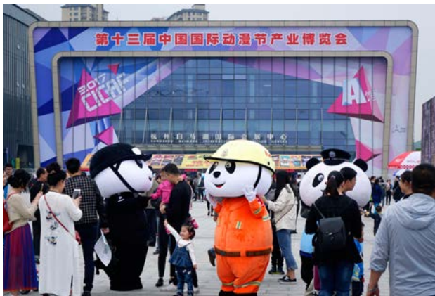
4月26日，第十三届中国国际动漫节在杭州滨江白马湖动漫广场开幕

4月26日晚，第十三届中国国际动漫节“金猴奖”颁奖仪式暨获奖作品分享会在浙江国际影视中心举行。大赛由中国国际广播电台主办，中国国际动漫节执委会、浙江广电集团、中国美术学院三方共同承办。本届大赛共收到国内外动漫参赛作品1070件。参赛电视系列片覆盖了国家新闻出版广电总局2016年度、2017年度推优作品，动画电影基本囊括了2015年度、2016年度票房5000万元以上的市场大作，以及国内外动画院校近年创作的优秀动画短片、网络点击率过亿的漫画连载等。最终，《西游记之大圣归来》获得了动画电影类金