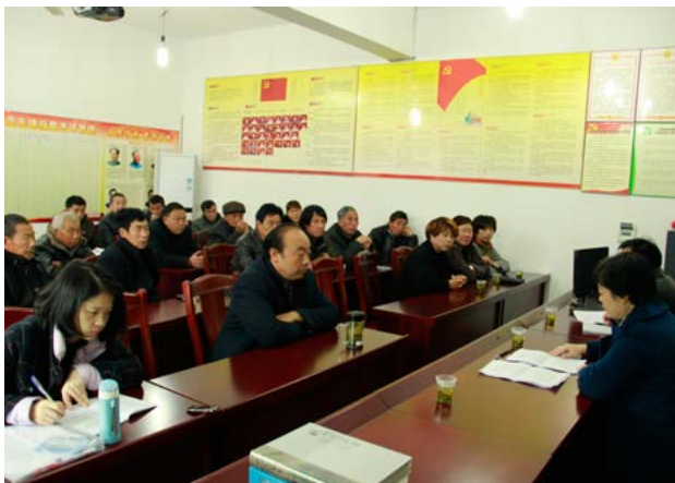
参加宣讲会的村民认真听讲